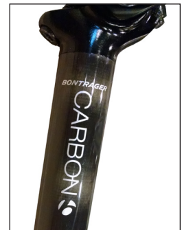
FIGURA 2. Reggisella in carbonio Bontrager Approved