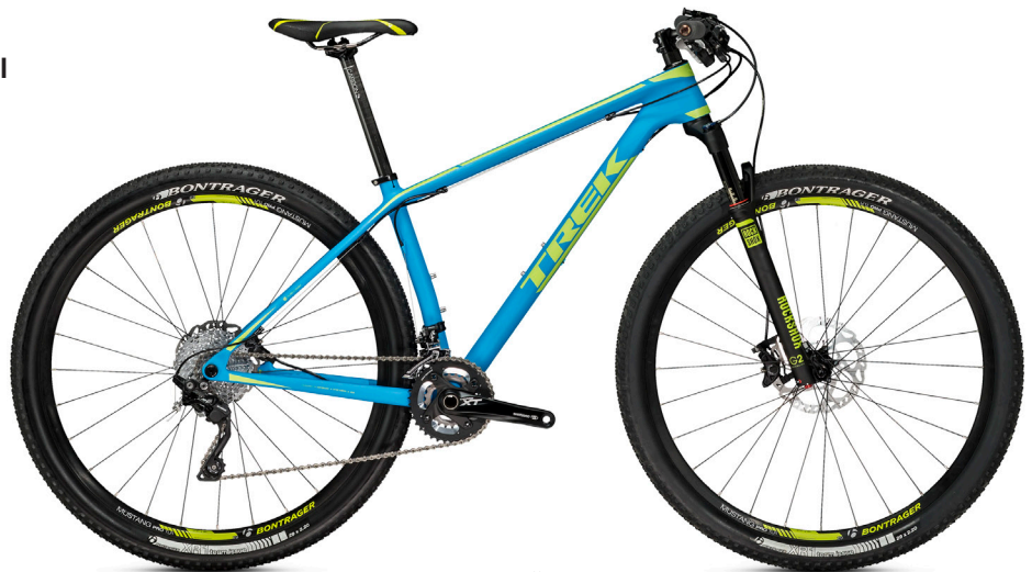
2015 Superfly 9.8 XT