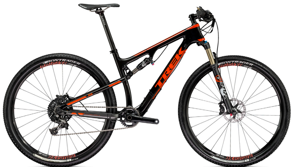
2015 Superfly 9.8 FS SL