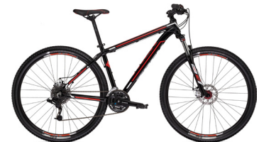
2013 Trek Marlin