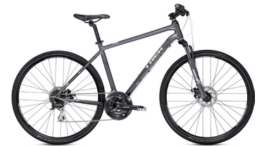
2013 Trek 8.3 DS