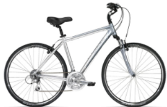
2011 Trek 7300