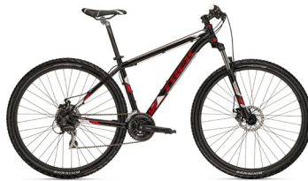
2012 Trek Wahoo