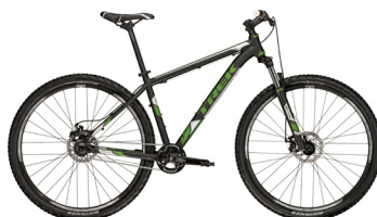
2012 Trek Marlin SS