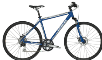
2012 Trek 7300