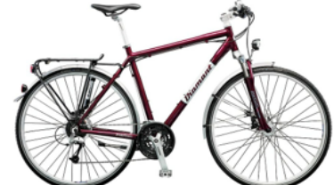
2013 Diamant Elan Legere