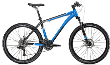
2011 Trek Wahoo