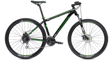
2013 Trek Wahoo