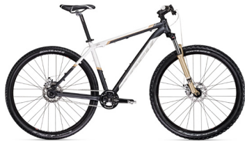
2011 Trek Marlin SS