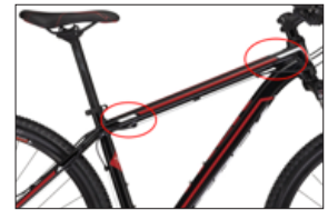
Abb. 2. Stelle des Modellnamens

Der Modellname steht auf dem Rahmen, normalerweise am hinteren Ende des Oberrohrs (siehe Abb. 2).