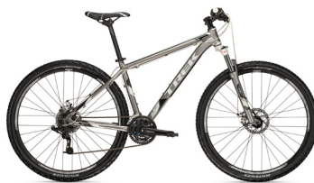
2012 Trek Marlin