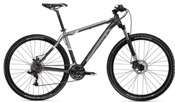
2011 Trek Marlin