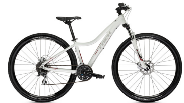
2013 Trek Cali